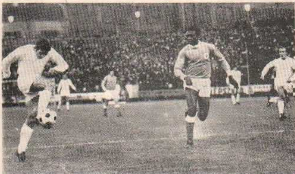
Útočný futbal maďarského majstra charakterizuje aj záber zo strelnutia Dózsa — Benfika 2:0 v II. kole PEM. Strelecký pokus Nagya sleduje stopper Benfiky Messias a známy maďarský reprezentant Bene.