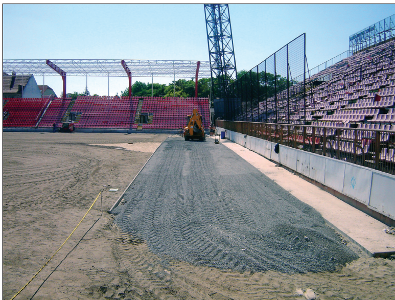
Príprava podložia pod umelý trávnik po obvode ihriska