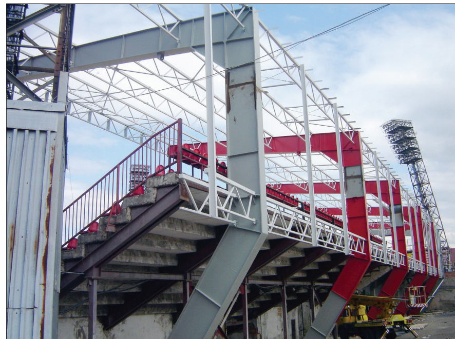
... zopár záberov z rekonštrukcie západnej tribúny