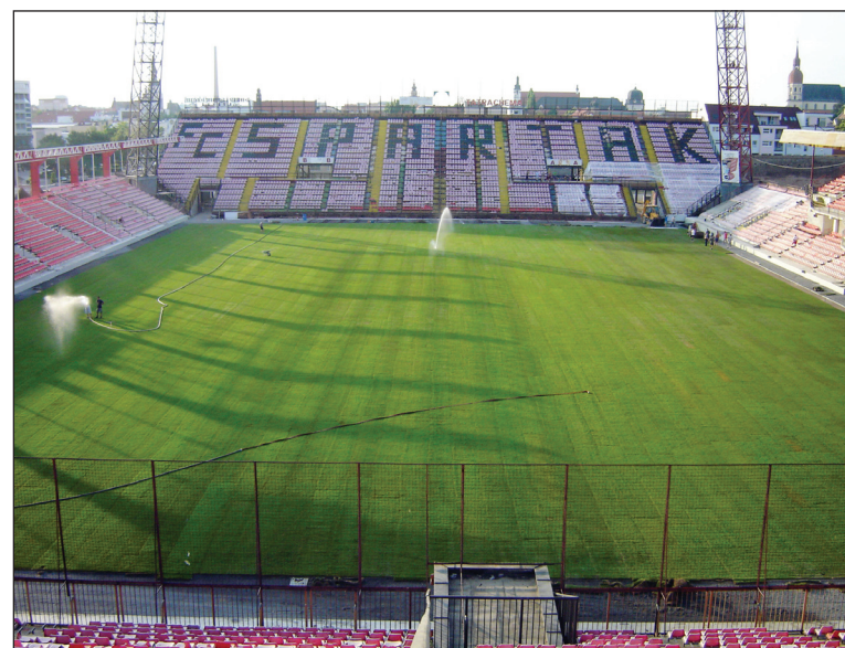
Prvé zavlažovanie nového trávnik