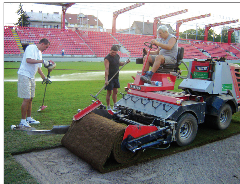
Pokládka je takmer ukončená