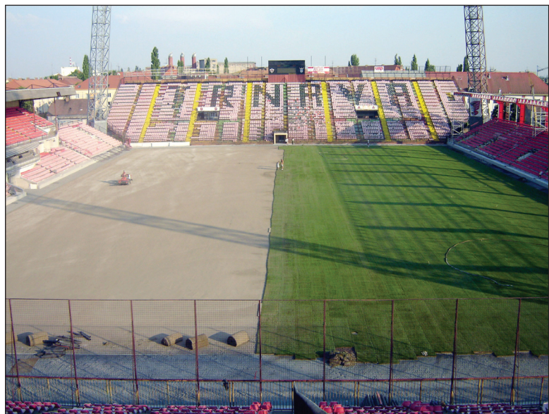
Priebeh ukladania trávneho koberca