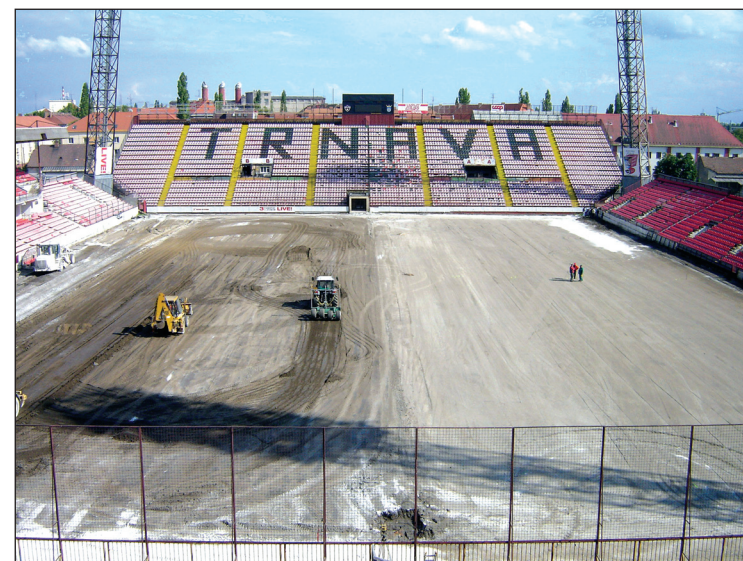
Vyrovnávanie podkladu po odstránení trávnik