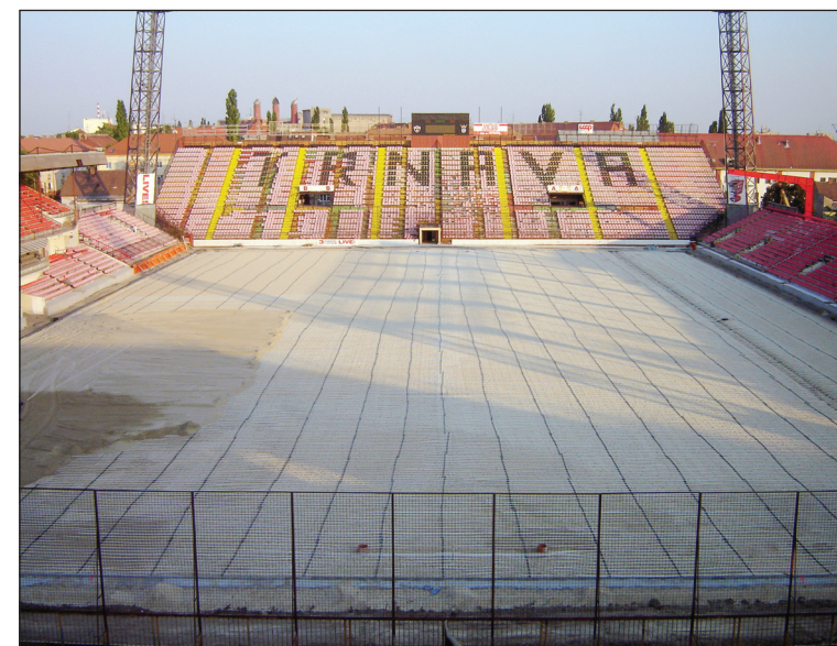
Uloženie trúbok vykurovacieho systému