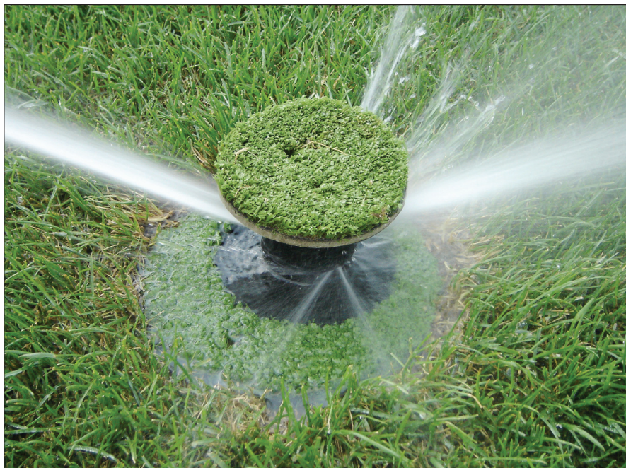
Zavlažovací terč v činnosti