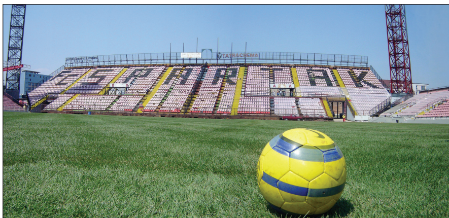
Prvé stretnutie trávnik s loptou