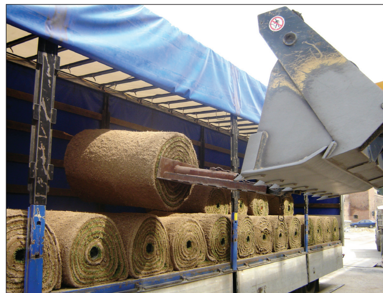
Presun dovezeného trávnik