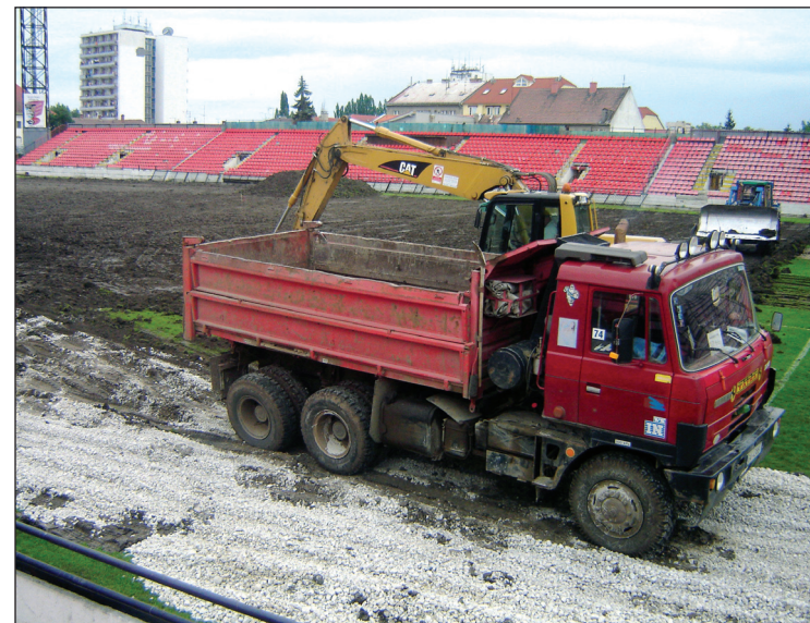
Odstraňovanie starého trávnik