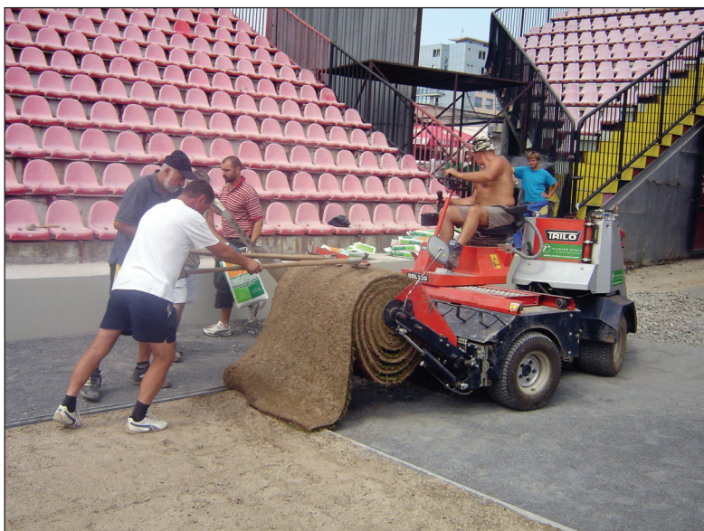
Ukladanie prvého balu