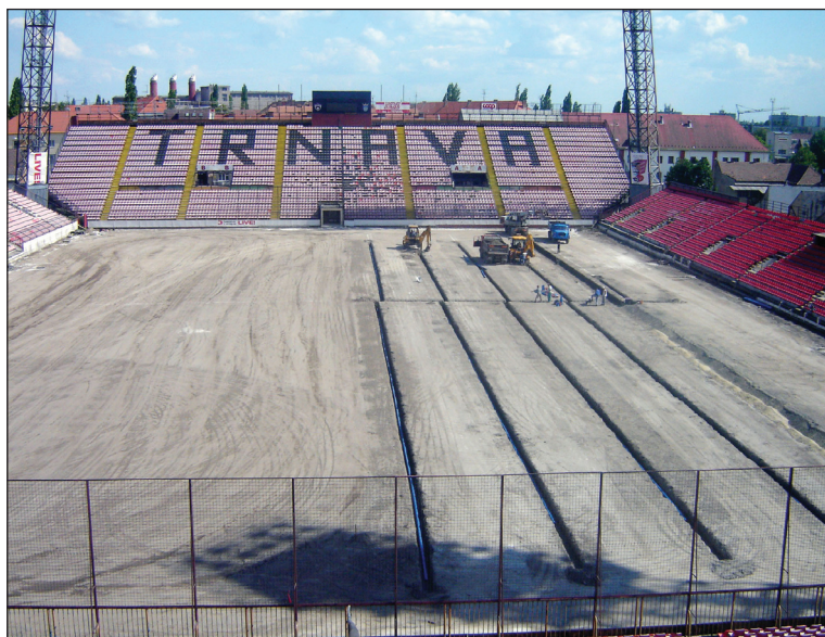
Realizácia drenážneho systému