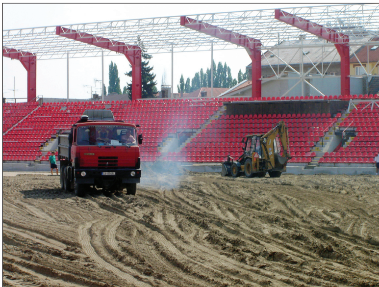
Zásyp vykurovacieho systému a príprava podložia pod trávnik