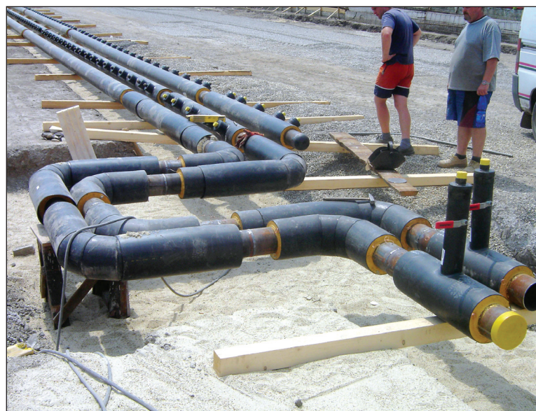
Hlavná vetva vykurovacieho systému